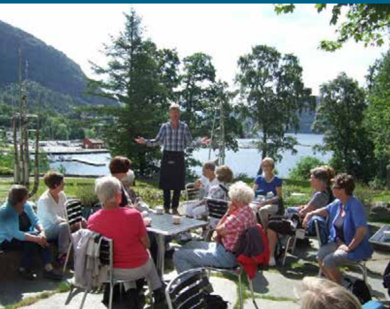
Rosehagen Kultur og Næringspark, Jørpeland.