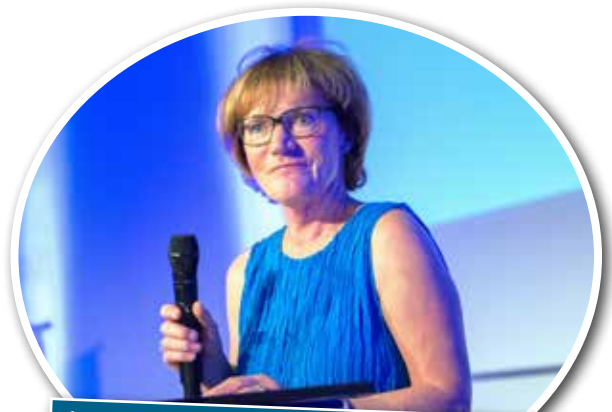
Årets sykepleierleder takker de som har bidratt til at hun ble Årets sykepleierleder i Rogaland i 2013.

Fylkesstyret i NSF Rogaland har vedtatt å del ut priser for Årets sykepleier og Årets sykepleierleder også i 2014. Har du en kollega du mener fortjener å bli foreslått må du gjøre det innen 31. desember. Les mer på siste side !