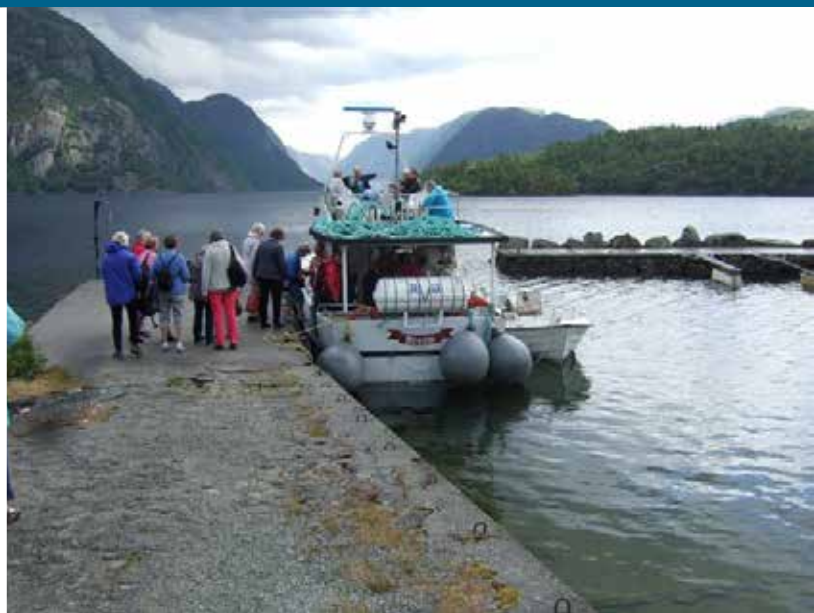
Båttur over Tysdalsvannet.